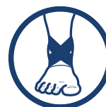
ÓSEMkowe PASY KRZYŻOWE

www.reh4mat.com e-mail: biuro@reh4mat.com