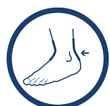
ORTEZA STAWU SKOKOWEGO

Dużym atutem ortezy kostki AM-OSS-05 jest to, że dzięki swej uniwersalnej konstrukcji, nie jest on dedykowany na konkretną nogę. W ortezie zastosowano system mocnego sznurowania oraz miękki język, który skutecznie odciąża miejsce sznurowania. W wyrobie zastosowano dwustronne, wyprofilowane stalki, dzięki czemu uzyskano wyrób skutecznie usztywniający staw skokowy i jednocześnie doskonale dopasowujący się do stopy pacjenta. Konstrukcja ortezy pozwala na swobodne stosowanie jej w obuwiu sportowym i doskonale sprawdza się nie tylko w sportach halowych, ale także w każdej sytuacji wymagającej mocnej stabilizacji stawu skokowego. Wyrób zapewnia doskonałą stabilizację, dzięki zastosowaniu usztywnień bocznych, sznurowadeł przednich i dynamicznych taśm ósemkowych, które w doskonały sposób stabilizują cały staw skokowy i stopę.