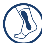
3OCZNE ANATOMICZNE WZMOCNIENIA